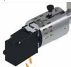
Tagliapasta Pasta cutter