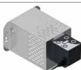
Tagliapasta automatico Automatic pasta cutter